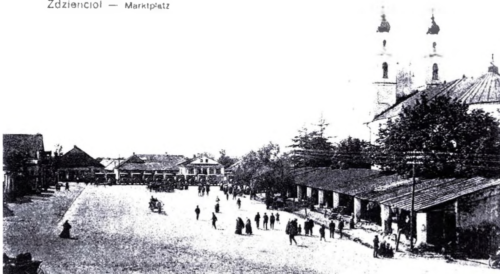
Рисунок 1 – Дятлово. Тоговая площадь, 1916 г.