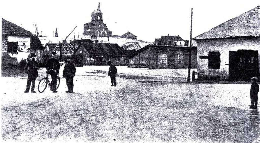
Рисунок 4 – Зельва. Торговая площадь, 1916 г.