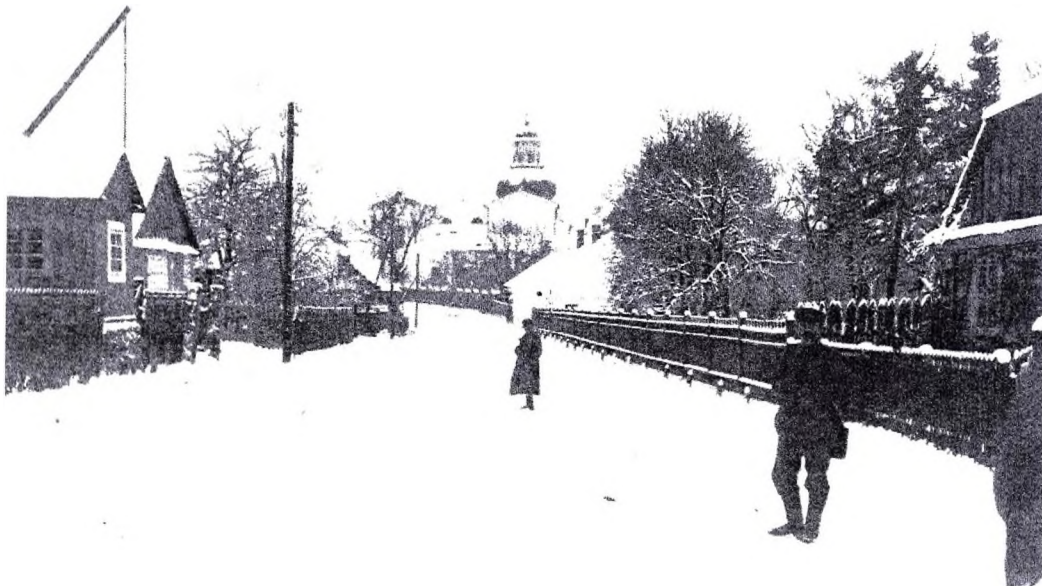
Рисунок 2 – Жировичи. Улица к Свято-Успенскому собору, 1916 г.