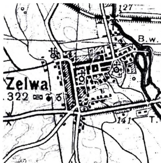
Рисунок 3 – Зельва. Фрагмент карты 1933 г.