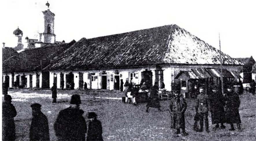
Рисунок 6 – Ружаны. Тоговая площадь, 1916 г.