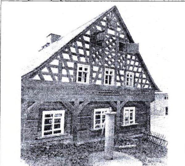
Малюнак 3 – Адзін з старэйшых вясковых драўляных жылых будынкаў Усходняй Германіі (1782 год пабудовы) мае зробленыя з бруса сцены і франтон фахвэркавай канструкцыі, бэлечныя перавязкі якога ўтвараюць лінейны дэкара-тыўны малюнак з ромбаў і касых крыжоў (Ландвюст, акруга Клінгэльталь).