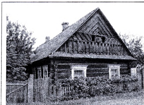
Малюнак 1 – Дэкаратыўнае афармленне цэнтральнапалескай хаты (г.п. Тураў, вул. Вароўскага 42, пачатак XX ст.)