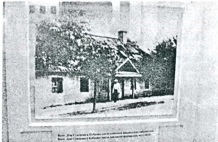
Рисунок 1 – Дом Суворова после Второй мировой войны

Суворовский городской дом, построенный в 1790-х гг. также принадлежал к эпохе классицизма. Одноэтажное деревянное здание было прямоугольным в плане с высокой вальмовой крышей. Симметричные фасады украшали два крыльца с треугольными фронтонами и поддерживающими их колоннами. Наружные стены дома оштукатурены. Окна здания украшали ставни с коваными элементами. При возведении дома использовалась конструктивная схема, где в середине здания располагается несущая, продольная стена, выполненная из кирпича. Стена сохранилась до сегодняшнего времени. В её толще расположены внутренние дымоходы. Этот своего рода прообраз центрального отопления был оправдан, исходя из экономических соображений. В начале XIX в. с владельцев городских домов взимали "подымный" государственный налог, в зависимости от количества труб. Соответственно, если на крыше имелась одна или две трубы, платили меньше. Дома, имевшие анфиладное строение, в итоге получали тёплую стену в каждой из комнат. Для отопления помимо печи иногда дополнительно строили камин. В Суворовском доме его также использовали, отсюда и вторая труба [2, с. 239]. Помимо дома Суворова, кирпичную продольную стену имеет усадьба Радзивиллимонты.