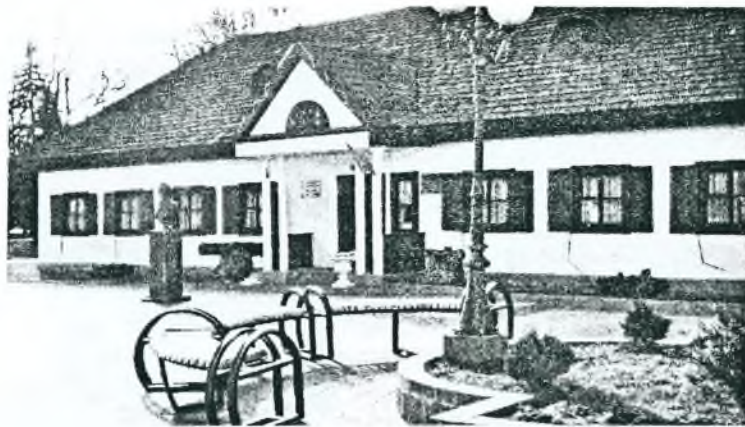
Рисунок 3 – Дом Суворова 2012 г.

Исходя из имеющихся графических изображений (картин, фотографий), произведённых обмеров, как самого здания, так и отдельных его элементов (дверей, ставен), а также проведённых исследований конструктивных особенностей здания, можно сделать вывод, что работа по воссозданию дома Суворова выполнена удачно. Воссоздан изначальный вид здания: гонтовая крыша с мансардными полукруглыми окнами, деревянные оштукатуренные стены. Здание располагается на том же фундаменте. К сожалению, не удалось полностью воспроизвести прежнюю планировку дома, так как перегородки были утрачены во время войны. В результате восстановления удалось воссоздать не только исторический памятник, но и с помощью размещённой в доме музейной экспозиции и восстановленных интерьеров передать атмосферу ушедшей эпохи.