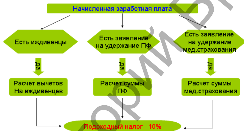
Рисунок 1 – Блок-схема алгоритма расчета подоходного налога по законодательству Республики Туркменистан

Для автоматизации расчета подоходного налога в Республике Туркменистан автором разработана блок-схема его алгоритма (рис. 1).