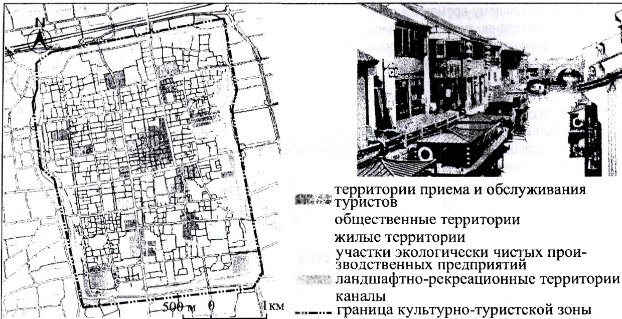
Рисунок 1 - Функциональное зонирование территории культурно-туристских зон г. Сучжоу