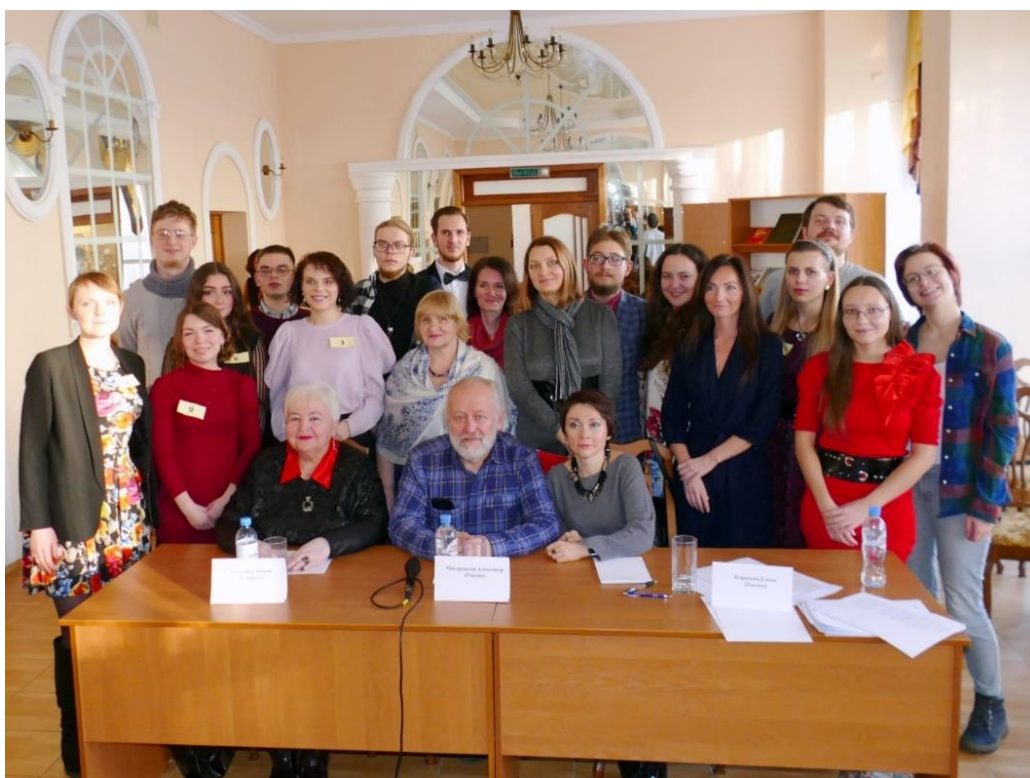
Международный конкурс молодых поэтов в Бресте, 03.12.2021

Многие годы она является членом жюри Международного конкурса молодых поэтов, организуемым РЦНК в Бресте, «Русским обществом», Брестским отделением Союза писателей Брестчины.