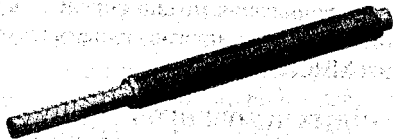
Рисунок 1 – Конечно-элементная сетка ходового винта

В качестве граничных условий приложены тепловые поля, определенные при термическом анализе, а также схема закрепления винта в опоре. Для получения деформаций в разных временных интервалах последовательно изменяется тепловое поле, принимаемое из термического анализа. Термоупругий расчет реализован на примере ходового винта МЦС с ЧПУ модели МС 12 – 250, обеспечивающего перемещение салазок станка вдоль координаты У, как наиболее подверженного влиянию тепловых деформаций. Схема закрепления винта – консольная, то есть один конец винта закреплен, а второй свободный. По геометрическим размерам создана трехмерная твердотельная полноразмерная модель винта в графической среде Solid Works, при дискретизации которой построена конечно-элементная сетка (рисунок 1).