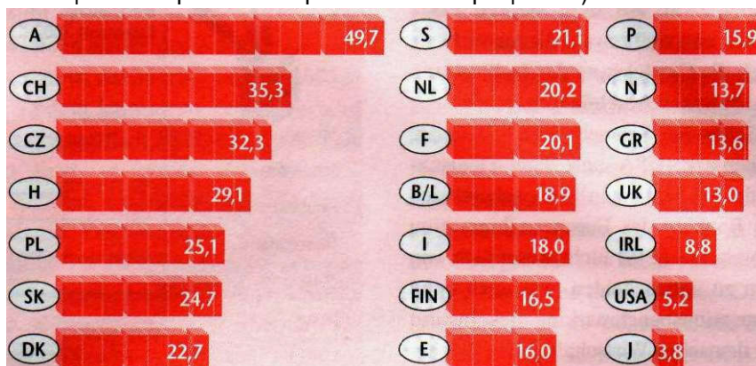
Диаграмма 2. Потребление немецких товаров в разных странах ( доля немецких товаров в импорте 2004 г. в процентах)

Когда завершился 2005 г., федеральное правительство весьма ударно вступило в новый 2006 г. – 25-миллиардное соглашение должно придать дополнительный размах экономике. Такой пакет мероприятий, который часто называют конъюнктурной программой, действует на первый взгляд впечатляюще. Но при более близком рассмотрении появляются значительные сомнения в том, поможет ли «сильный финансовый укол пациентам» Германии. Существуют две основные критические точки зрения: