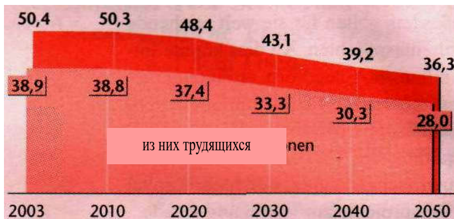
График 1. Изменение количества населения (население в возрасте от 20 до 65 лет в миллионах)

Следовательно, перед правительством появляется новая задача: не ограничивать въезд иностранных граждан (как это происходило в недавнем времени), а наоборот, способствовать этому. Спорным является вопрос о том, удастся ли вообще привлечь так много рабочей силы в страну [10; 8]. А ещё одной дилеммой, которая напрямую вытекает из ситуации, является вопрос о том, сможет ли государство обеспечить приезжих не только работой, но и реальными доходами.