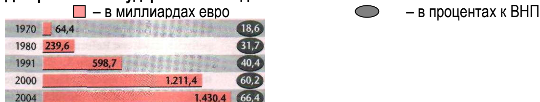
Диаграмма 3. Государственная задолженность

Но немецкая национальная экономика уже вступила на путь конъюнктурного оживления, который не «имеет перил». Необходимая стабилизация получает развитие через согласованную политику. Поэтому федеральное правительство должно было, прежде всего, быстро установить 3 рычага: