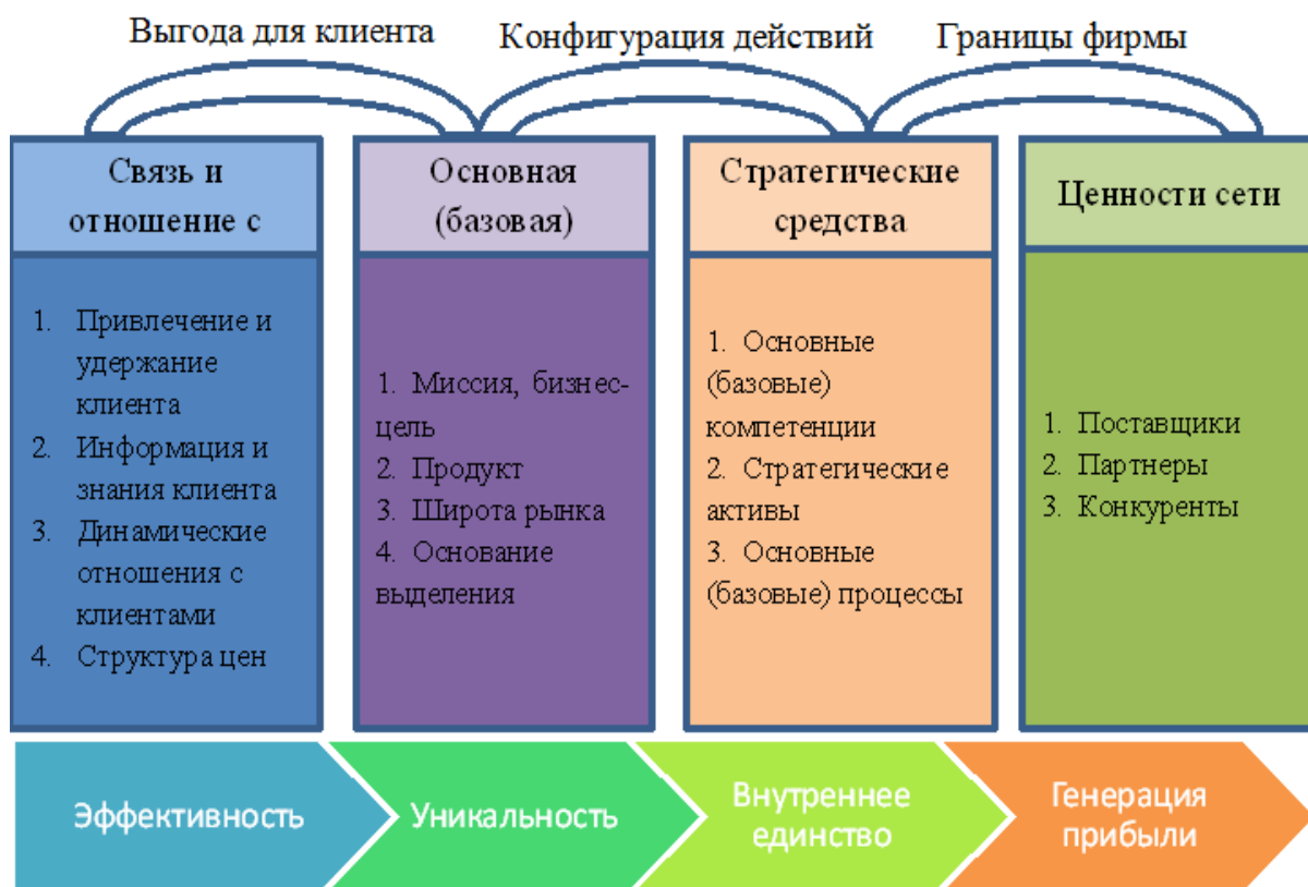
Рисунок 2 – Элементы инновационной бизнес-модели [3]

Четыре важнейших его элемента, то есть базовая стратегия, стратегические запасы, связь и отношения с клиентами, ценности сети взаимосвязаны, создавая характерные три «моста», которые приведены ниже: