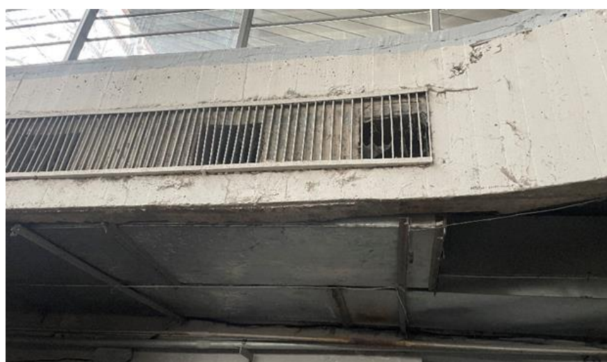
Рисунок 6 – Воздуховоды и воздухораспределительные решетки системы П1

В виду того, что в нормативной литературе для археологического раскопа отсутствуют допустимые параметры микроклимата, было проведено сравнение