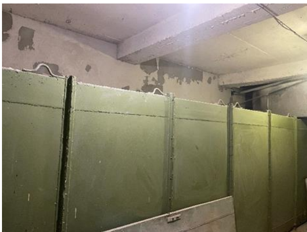
Рисунок 3 – Блок шумоглушения

осуществляться подача воздуха к раскопу. По факту часть из них работает на забор воздуха из помещения. Замеры в самом зале и по периметру археологического раскопа представлены в таблице 1.