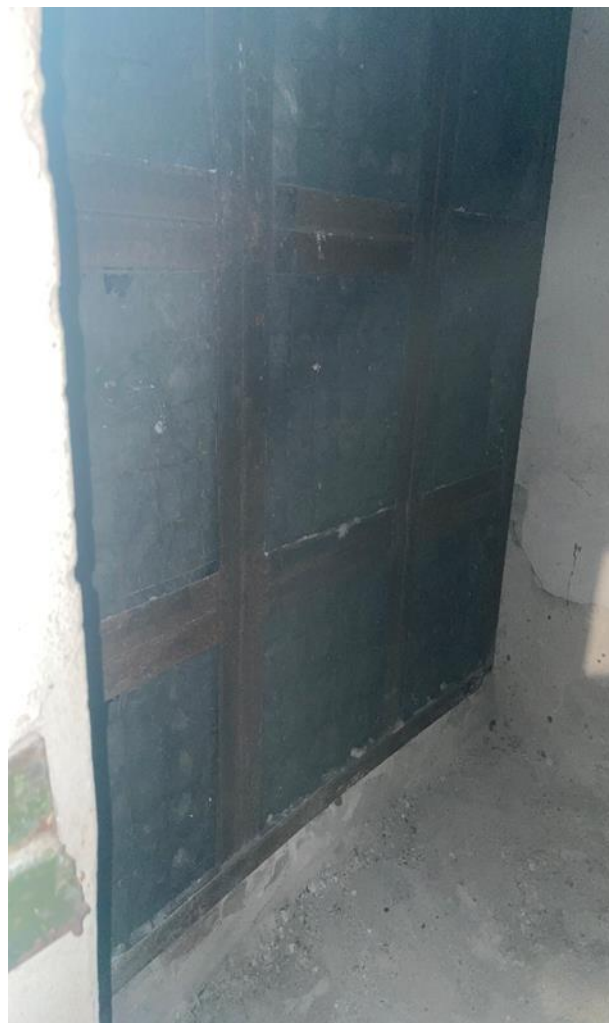
Рисунок 5 – Фильтр ячейковый