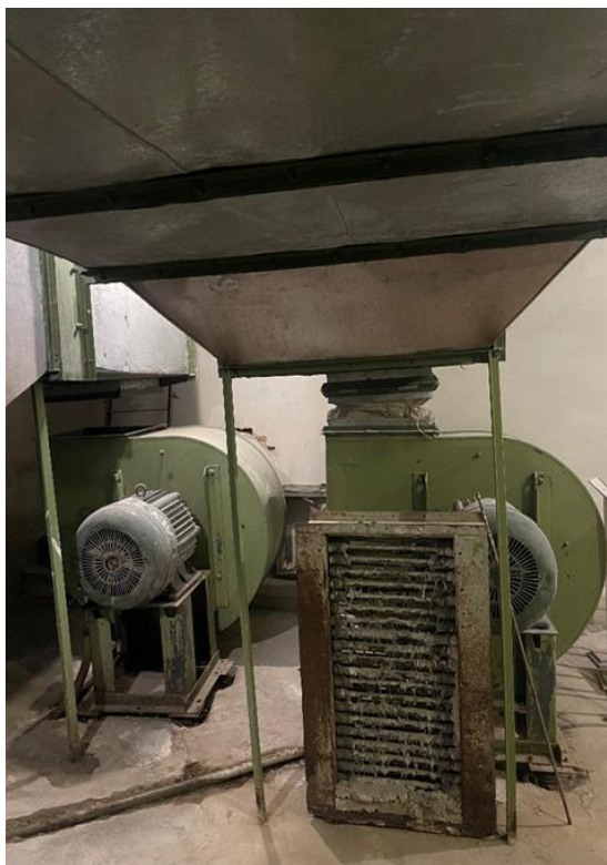
Рисунок 1 – Вентиляторы системы П1