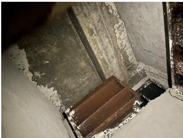
Рисунок 4 – Заслонка с ручным приводом