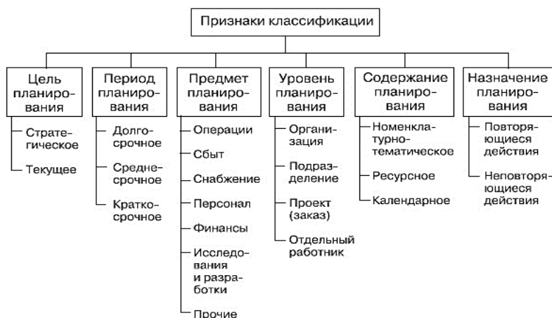
Рисунок 4 – Виды планирования

Технико-экономическое планирование – это планирование, которое определяет содержание производственно-хозяйственной деятельности организации и ее подразделений. Методы технико-экономического планирования – это приемы и способы определения и расчетов плановых показателей деятельности предприятия. Среди них: балансовый метод (предполагает сопоставление потребности и наличия материально-технических, трудовых и финансовых ресурсов и, при отсутствии баланса (равновесия) между ними, определении источников их покрытия); экспертный метод (основывается на прогнозах специалистов-экспертов по какой-либо проблеме); графоаналитический метод (предполагает представление результатов анализа графическими средствами); сетевое планирование (позволяет оценить сроки работ по бизнес-проекту); программно-целевое планирование (используется при разработке программ, стратегического плана); расчетно-аналитическое планирование (предусматривает исследование результатов расчетов, факторный анализ); экономико-математическое планирование (моделирование в планировании).