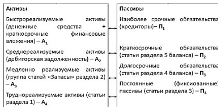
Рисунок 3 – Сравнение активов и обязательств предприятия по степени ликвидности

При анализе раздела I Бухгалтерского баланса рассматриваются тенденции изменения основных средств, нематериальных активов, доходных вложений в материальные активы, вложений в долгосрочные активы, долгосрочные финансовые вложения, отложенные налоговые активы, долгосрочная дебиторская задолженность, прочие долгосрочные активы, их удельный вес к итогу долгосрочных активов.