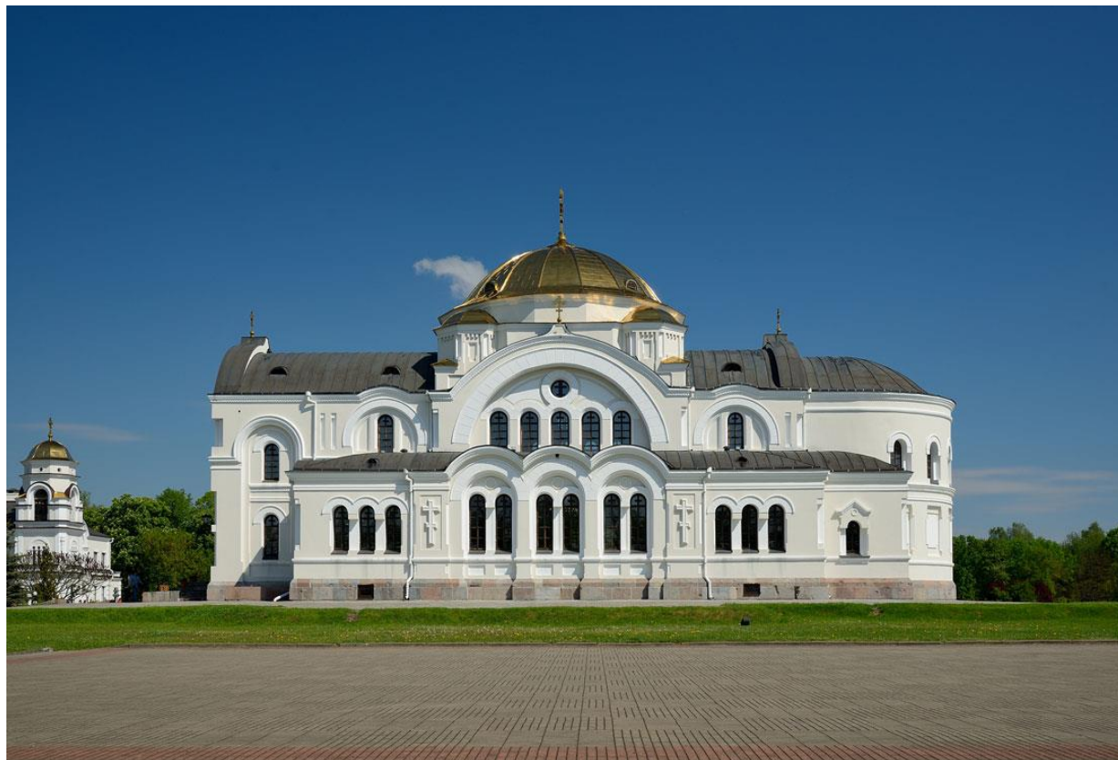
Фото 2 – Гарнизонный храм святителя Николая Чудотворца в Брестской крепости, 2022

Если внешний вид храма уже восстановлен (фото 2), то внутренние реставрационные работы осложнены наличием повышенной влажности стен.