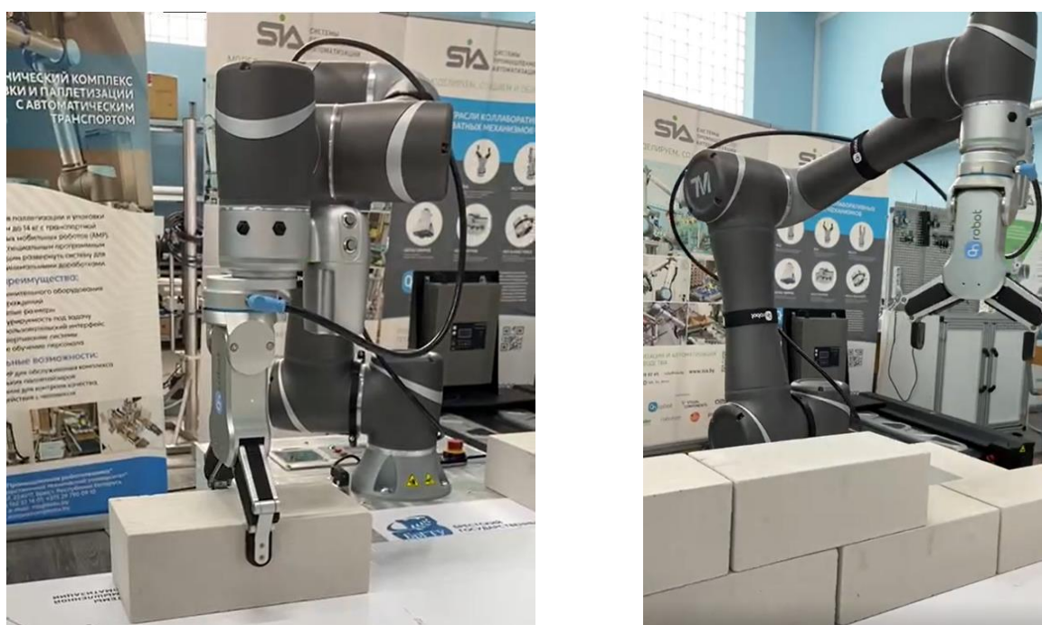
Рисунок 2 – Процесс укладки кирпича в конструкцию модели перегородки

На данный момент робот-каменщик осуществляет захват и фиксацию кирпича с определенной точки своей платформы, выкладывает кирпичную кладку модели перегородки насухо, без использования раствора, оставляя зазоры на вертикальный шов (рисунок 2).