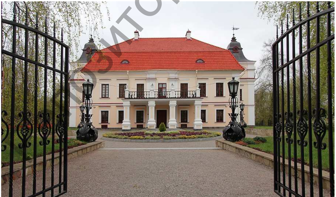
Рисунок 6 – Дворец в Скоках после реставрации. 2019 г.