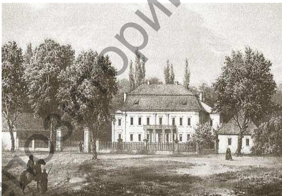
Рисунок 2 – Скоки, усадьба Немцевичей

Прогулочный маршрут кольцевого типа проходил вдоль вала и небольшого канала, за которым рос сад. В уединенной части парка находилась беседка, которая открывала живописные окрестности. С востока к парку примыкал ипподром.