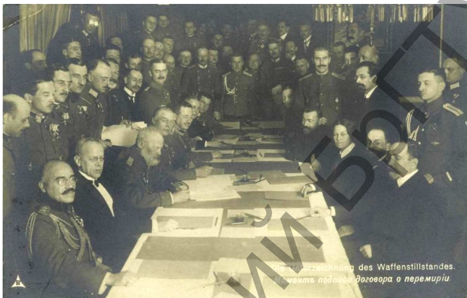
Рисунок 3 – Принц Леопольд подписывает договор о перемирии. Скоки 15 декабря 1917 г.

Во время Первой мировой войны почти на 2 года дворец стал ставкой командующего Восточным германским фронтом принца Баварского Леопольда (рис. 3). Здесь 15 декабря 1917 г. было подписано военное перемирие, а через 2 дня – первое организационное заседание по проведению переговоров о заключении мира, который был, затем, подписан 3 марта 1918г. в Брестской крепости, в Белом Дворце. В это время пострадала вся усадьба. Офисина и конюшня были разрушены.