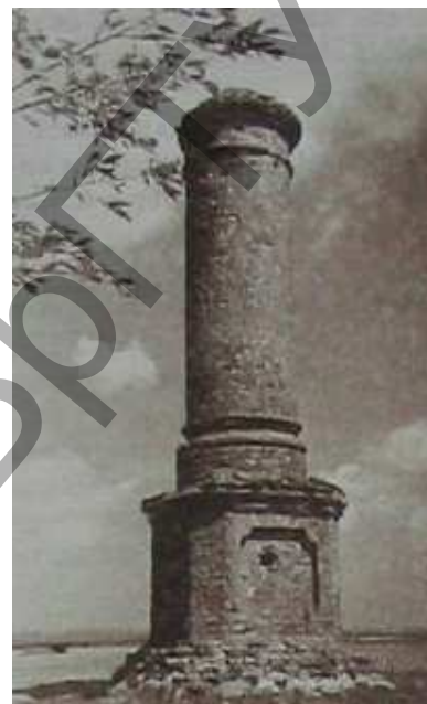
Рисунок 1 – «Рахвал». 1957 г.

Мать Юлиана Немцевича (Ядвига Суходольских) родила шестнадцать детей, восемь из которых умерли в раннем возрасте. Марцелий Немцевич установил на территории усадьбы каменную колонну (в 2,25 км от сохранившегося дворца Немцевичей), увенчанную деревянной статуей архангела-врачевателя Рафаила, колонна сохранилась до сих пор, статуя утрачена. Местность, где стоял дом, в котором родился Юлиан Урсын Немцевич, до сих пор носит название Рахвал (рис. 1).