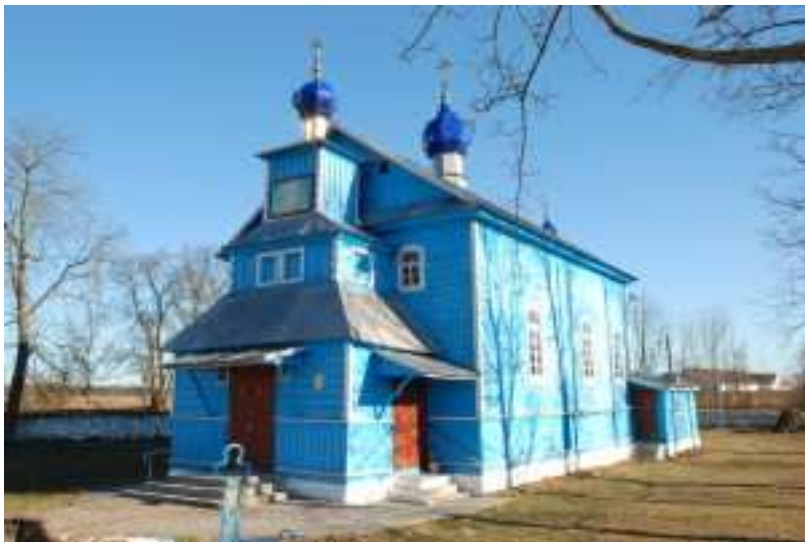
Рисунок 6 – Успенская церковь д. Паниквы Каменецкого района

угнали в Беловежу для отправки в Германию. Детей отобрали и передали жителям соседних деревень. Когда яма была готова, к ней подогнали всех оставшихся жителей Рожковки. Возле свежевырытой могилы были установлены четыре пулемета. Зачитали приказ о расстреле «за помощь бандитам и укрывательство советских парашютистов». Неожиданно рядом с местом казни приземлился легкомоторный самолет. Из него вышел немецкий майор. Приказал, чтобы до его возвращения никого не расстреливали. Майор улетел, но через 45 минут вернулся. С приказом о помиловании. Ошеломленным людям он рассказал, что, когда летел в самолете, ему явилась Божия Матерь в голубом одеянии и указала на яму, где вот-вот должна была совершиться казнь. Поэтому он, пораженный видением, посадил самолет, чтобы заступиться за несчастных. И вот уже на протяжении 75 лет 28 сентября в дер. Рожковке – это самый главный праздник. Из тех, кто стоял на краю расстрельной ямы, в живых давно никого не осталось. Но сохранились их воспоминания на страницах книги «Память» Каменецкого района.