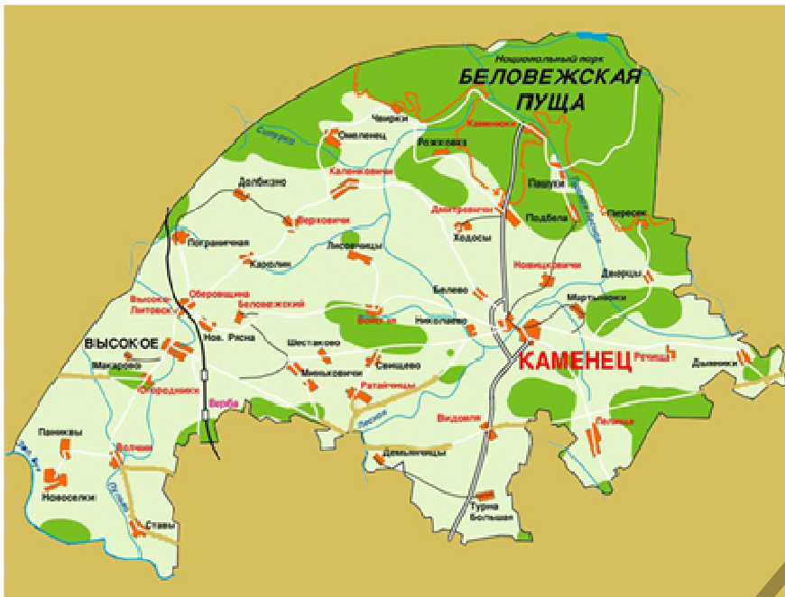
Рисунок 1 – Карта Каменецкого района