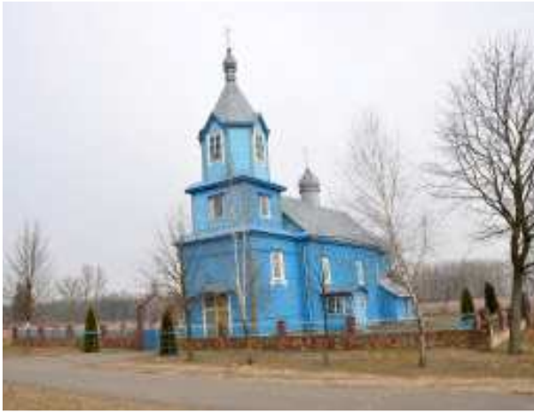
Рисунок 2 – Петро-Павловская церковь в д. Городище Каменецкого района