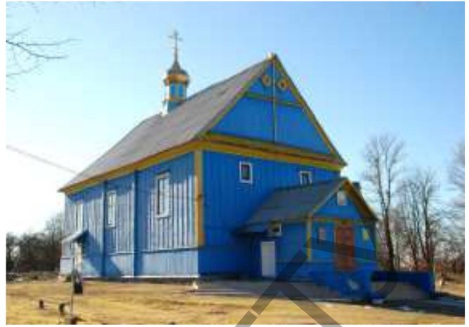
Рисунок 3 – Спасо-Преображенская церковь в д. Дмитровичи Каменецкого района

5. Воскресенская церковь в д. Огородники находится на кладбище, построена из дерева в 1841 году. Представляет собой традиционный тип трехсрубового храма. В годы гонений храм был закрыт, 28 мая 1994 года по благословению Архиепископа Брестского и Кобринского Константина храм был освящен благочинным Каменецкого округа священником Евгением Лукашевичем в сослужении духовенства Каменецкого благочиния (рис. 5).