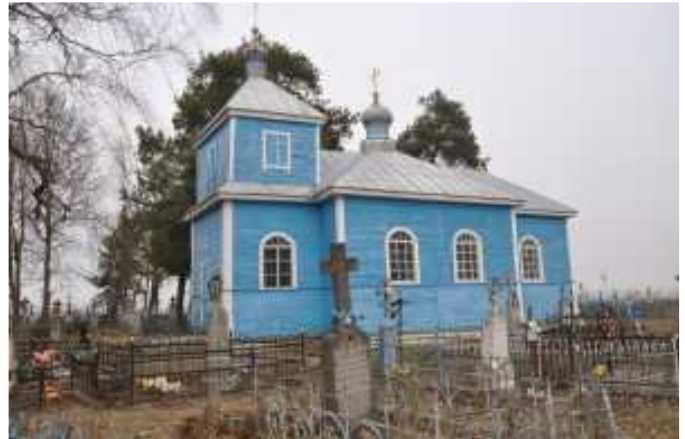
Рисунок 5 – Воскресенская церковь в д. Огородники Каменецкого района

Рожковка – небольшая деревушка на краю огромной Беловежской пуши. На въезде – кладбище. Чуть дальше – заброшенные здания, в которых когда-то размещались почта и школа. Рядом – деревянная церковь. Через всю деревню ведет мощенная камнем дорога, построенная еще «за польским часам». Сразу за селом – два креста. Их установили в память о событиях 28 сентября 1942 года. 75 лет назад Рожковка должна была повторить трагичную судьбу Хатыни. Сегодня в Рожковке проживает не больше полусотни человек. А до войны здесь насчиты-