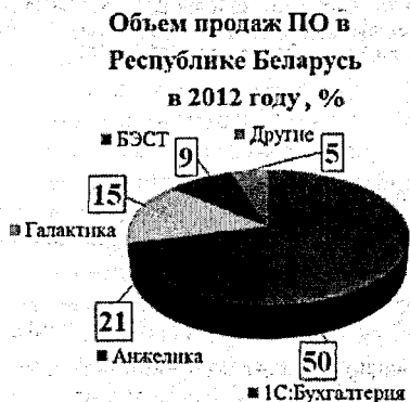
Рисунок 1 – ПО в Республике Беларусь

Маркетинговые исследования установили, что наибольший объем продаж программного обеспечения для автоматизации бухгалтерского учета в Республике Беларусь занимает «1С» и «Анжелика (Гедымин)» (рисунок 1), в России – «SAP» и «1С» (рисунок 2), а в Туркменистане – «Ochag Software» и «Phoenix Software» (рисунок 3).