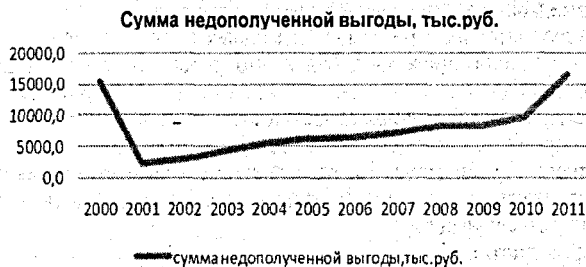
Рисунок 1 – Сумма недополученной выгоды в Республике Беларусь от нетрудоспособности у потерпевших на производстве

В данном исследовании мы рассматриваем вопрос бухгалтерского отражения потерь от производственных травм и профессиональных заболеваний на уровне предприятия.