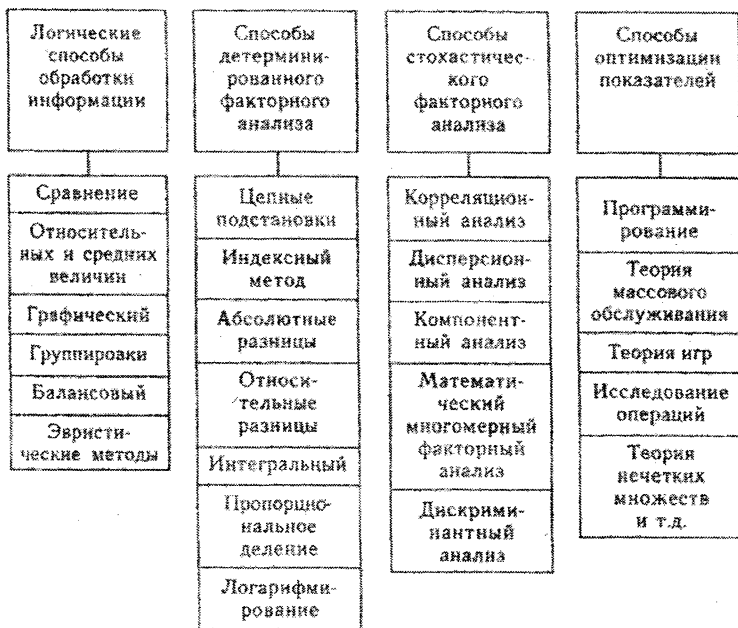
Рисунок 1 – Способы анализа хозяйственной деятельности предприятия [1]

Способ относительных и средних величин. Средние показатели определяются на основе массовых, качественно однородных данных. Они дают обобщенную характеристику изучаемым процессам и явлениям. Сравнение фактических данных со средними показателями позволяет установить, на каком уровне находится предприятие и выявить неиспользуемые возможности для улучшения хозяйственной деятельности. Относительные показатели используются для дополнения абсолютных значений и определяются делением одного показателя на другой, который принимается за базу сравнения (факт/план).