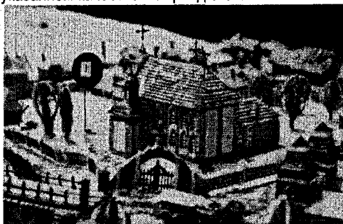
Фото 2 – Доминиканский костел

Монастыри бернардинцев и бернардинок Бреста – единственные сооружения этого ордена в Беларуси, образовавшие ансамбль вокруг площади. Фасады костелов монастырей Бреста замыкали площадь за Бернардинским мостом через Мухавец и служили гигантским обрамлением дороги, ведущей из Украины. В других городах (Минск, Слоним) оба бернардинских монастыря стояли независимо один от другого и даже рядом расположенные (Минск) не образовывали комплекса.