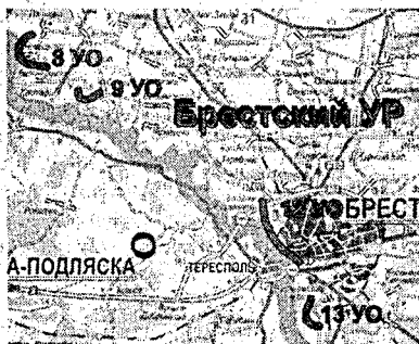
62-ой Брестский УР

Современное состояние фортов и дотов даже описывать стыдно. Многие из них превращены в свалку для мусора, некоторые «оккупированы» организациями под склады, остальные заброшены и постепенно разрушаются. Борьба с этим, похоже, никто и не пытается. Кстати, у нас в Беларуси укрепрайоны разбросаны практически по всей территории, и, насколько нам известно, везде ситуация приблизительно такая же. Если старые укрепления привести в порядок, здесь можно устроить туристический маршрут, провести интереснейшие исследования. Ведь доты – не только памятники фортификации,