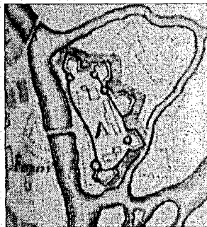
План Брестского замка, 1657 год

Крепость была возведена на четырех островах, образованных рукавами рек Мухавец и Западный Буг и системой искусственных обводных каналов. Общая длина оборони-