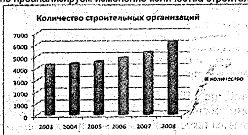
Рисунок 1 – Количество строительных организаций (всего) в период с 2003 по 2008 год (на конец года, единиц)

На первом этапе проанализируем изменение количества строительных организаций.