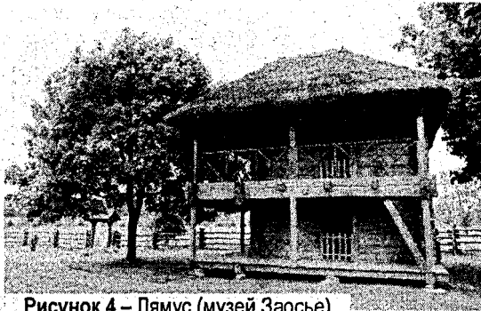
Рисунок 4 – Лямус (музей Заосье)

Строились в помещичьих усадьбах жилые дома для слуг батраков – «оффицины» – во внешнем облике которых обычно находили проявление региональные особенности народного зодчества. Также возводились и другие усадебные постройки. Например, очень интересными сооружениями были ярусные браны. Их появление связано с влиянием оборонительной архитектуры. Позже браны утрачивают свою оборонительную