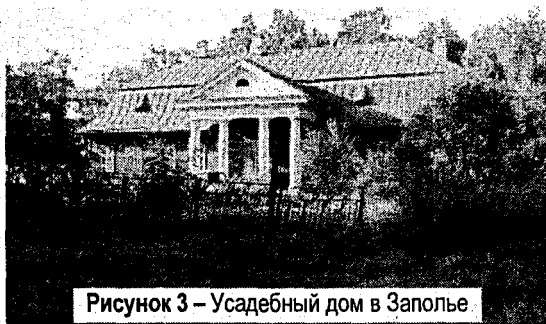
Рисунок 3 – Усадебный дом в Заполье

Симметрия планировочного решения усадебного дома определяла строгую осевую симметрию фасадов, особенно главного, а также равновесие объемов. Всегда композиционно выделялся главный вход в здание. Это достигалось ритмичным, направленным к центру построением фасада, а