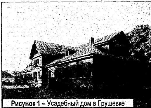
Рисунок 1 – Усадебный дом в Грушевке

Более подробно остановимся на деревянном усадебном зодчестве. Формирование жилых домов помещичьих усадеб происходило на рубеже XVI–XVII вв. Первоначально это были дома небольших размеров, мало отличающиеся от крестьянских построек. Характерная их особенность – планировочная схема, основанная на симметричном размещении комнат по обе стороны сеней. Широкое распространение имело традиционное трех-