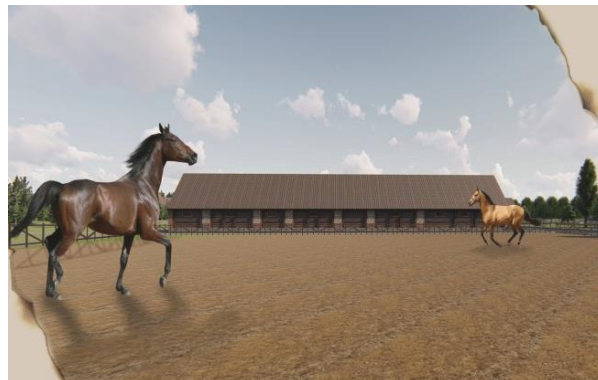
Рисунок 6 – Стойня и ее 3D-модель реставрации

На берегу озера есть бровар. Здание в хорошем состоянии, отличается профессиональной техникой исполнения; использовалось как сарай, аптека, котельная и жилье. Он состоит из четырех производственных блоков разной высоты, покрытых двускатной крышей (рисунок 7–8). Его длина по фасаду 44 м,