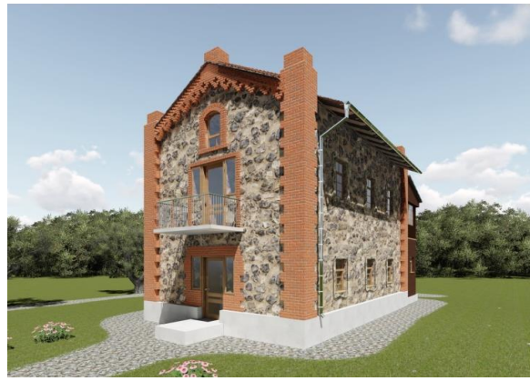
Рисунок 9 – Жилое здание и его 3D-модель реставрации

Можно сделать вывод, что постройки усадебного комплекса Новицких имеют характерные черты барочного классицизма и являются неоспоримым фактом смешения стилистических эпох. К сожалению, часть архитектурных памятников не сохранилась до наших дней, либо находится в плачевном состоянии. Чтобы побороть эту проблему, в качестве культурно-ландшафтных феноменов начинают исследоваться выдающиеся по художественным характеристикам и исторической значимости дворцово-парковые ансамбли, дворянские усадьбы, монастырские комплексы, поля сражений, археологические комплексы.