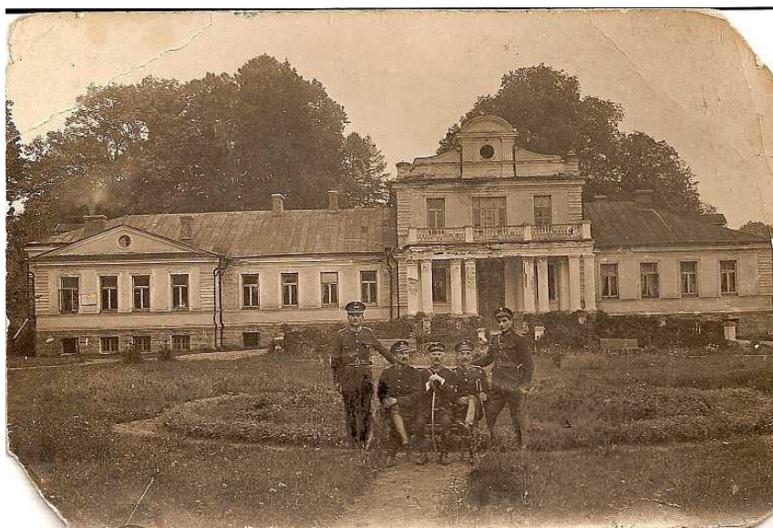
Рисунок 1 – Архивное фото усадьбы, примерно 1920 г.

Дата строительства совейковского ансамбля остаётся невыясненной. Но по отдельным архитектурным деталям и элементам можно сделать вывод, что усадьба была построена в конце XVIII – начале XIX вв. Что касается стиля (рисунок 1), то постройки имеют смешанный характер барочного классицизма, из-за того что были построены в переходный период.