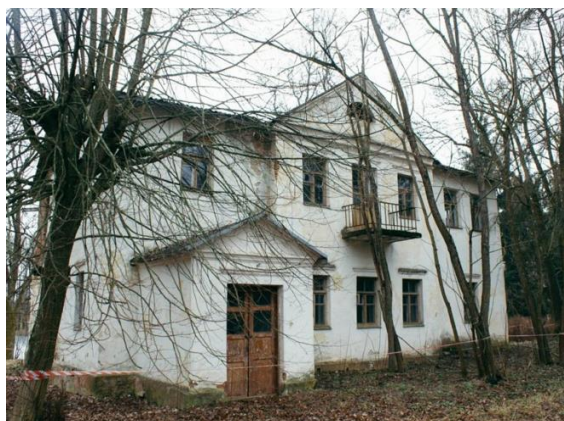
Рисунок 4 – Флигель