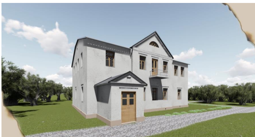
Рисунок 5 – 3D-модель реставрации флигеля

Хозяйственные постройки расположены по всей территории. Некоторые служили местом для хранения уборочного инвентаря. Также сохранилась постройка, которая раньше была конюшнями (рисунок 6). Из себя представляет деревянную конструкцию. Крыша выполнена из металлических листов, а стены из деревянных досок.