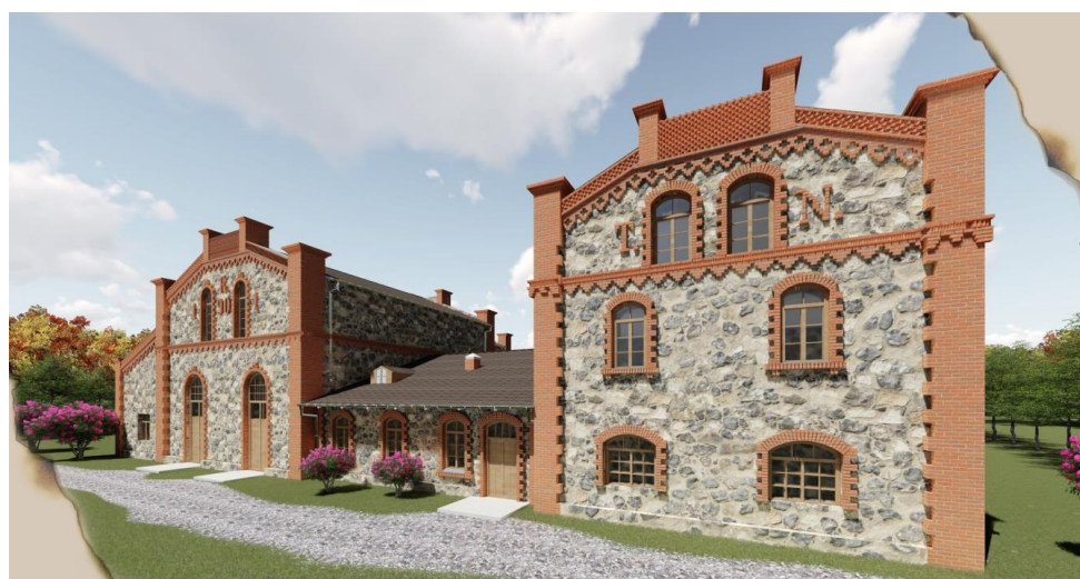
Рисунок 8 – 3D-модель реставрации бровара

Рядом находится двухэтажное здание (10,59 м), построенное в той же технике. Своеобразно обложенные красными тесаными камнями и очерченные белым цветом оконные проемы создают очертания подобно раскрытым бутонам цветов. Используется под жилье. Кроме самого дома сохранилась скульптура медведей, советской женщине, оленей, множество старинных ваз (рисунок 9) [1].