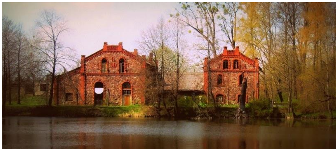
Рисунок 7 – Цеха бровара

ширина 18 м. Наружные корпуса двухэтажные, соединяющее их среднее одноэтажное. Здание построено из крупного бутового камня красного и серого цветов разных оттенков, высеченного в виде прямоугольных блоков. Камни укладываются регулярными рядами, создавая красивую кладку. Углы, а также пояс, отделяющий верхний этаж от нижнего, выложены красным кирпичом. Фигурные линии фасадов украшены сеткой из поребрика с гирьками, на фронтонах дата постройки «Е: 1901, инициалы владельца ТМ». Стены фасадов изрезаны двумя большими оконными проемами с полуциркульными завершениями, низкие лучковые окна располагаются на боковых и задних стенах. Был небольшой завод по производству мыла и стеариновых свечей [1, 3].