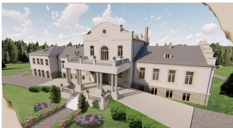
Рисунок 3 – 3D-модель реставрации усадебного дома

Рядом с усадебным домом можно увидеть двухэтажную постройку – флигель. Из всех зданий его состояние самое плохое – это связано с тем, что обрушилось перекрытие (рисунок 4–5). Флигель оштукатурен, имеет декоративные карнизы. Фронтон так же декорирован.