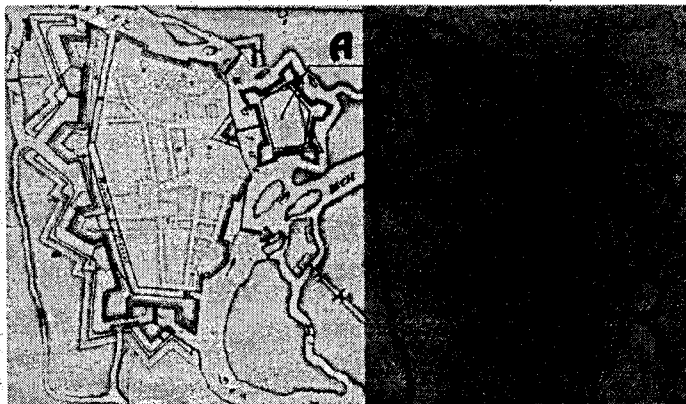
1 – план инженера Бонелля под руководством Дальберга, 2 – план Дальберга Рисунок 2 – Планы Бреста

При внимательном изучении гравюры выявляется ряд неточностей в экспликации на плане и перспективном изображении. Суть проблемы в том, что указанная гравюра не является первоисточником. Кроме нее еще известны несколько эскизов плана города, а именно – план инженера Бонелля под руководством Эрика Дальберга, план собственно Дальберга (рис. 2), эскиз Боденера.