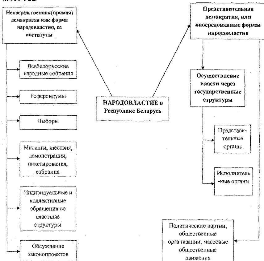
Схема 3.1.2. МЕХАНИЗМ ОСУЩЕСТВЛЕНИЯ НАРОДОВЛАСТИЯ В РЕСПУБЛИКЕ БЕЛАРУСЬ