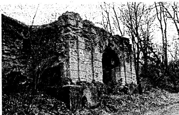
Рисунок 1 – Замковая брама

На противоположном берегу реки находилось, вероятно, неукрепленное поселение с нерегулярной, свободно сложившейся сетью улиц. Схема планировки относилась к Т-образному типу. В плане города отчетливо прослеживаются две планировочные оси: трассированные рядом современные улицы Кирова и 17-го сентября, переходящие в улицу Ленина, а также поперечная им градостроительно значимая тупиковая улица Советская. Предположительно, во второй половине XVII в., возможно, одновременно со строительством замка, была регулярно перепланирована старая торговая площадь, получившая прямолинейные очертания сторон.