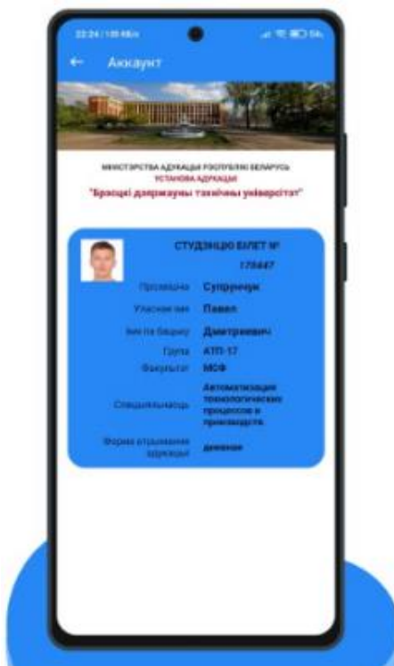
Рисунок 6 – Окно пункта меню «Аккаунт»

Пункт меню «Аккаунт» предназначен для вывода главной информации о студенте, группе, факультете, другими словами – своеобразный студенческий билет (см. рис. 6).