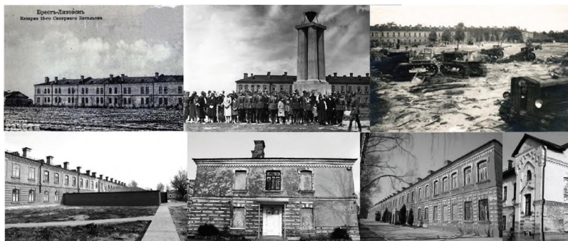
Илл. 2. Фотографии Северного городка г. Бреста, в котором была расквартирована 50-й гвардейская стрелковая дивизия: казарма 19 саперного батальона русской императорской армии, то же место – праздник в честь приезда в городок маршала Пилсудского, далее – место расквартирования советских танковых батальонов в 1939-1941 гг., последние три фото в коллаже – нынешний вид построек городка.

войны в июне 1941 года территорию городка практически не бомбили, потому что основной удар немцев направлялся на крепость.