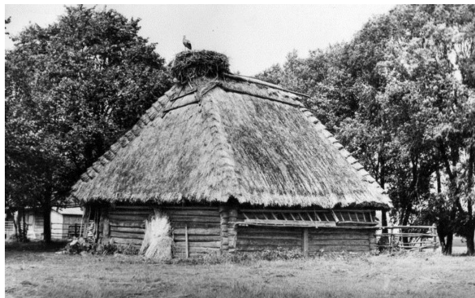
Рисунок 1 – Гумно («клуня») в д. Хабовичи Кобринского района (Западное Полесье). Фото 1978 г.

Данные различия в объектах архитектуры вместе с безусловно разными, порой уникальными географическими особенностями, предопределявшими различие природных комплексов, – рельеф, растительность, разнообразие животного мира, а также специфика производственной деятельности местного населения и даже конкретные приемы выполнения сельскохозяйственных работ, обеспечивали художественное своеобразие ландшафтов разных территорий (рис. 1–2).