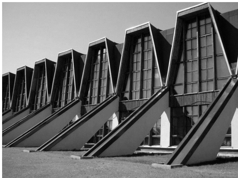
Рисунок 4 – Дворец лёгкой атлетики (легкоатлетический манеж «Динамо»).

Эти направления архитектуры могут рассматриваться и как достижения современного периода становления белорусского государства. При решении обязательных социальных задач, прежде всего связанных с обеспечением населения жильем и системами общественного обслуживания, найдены формы реализации индивидуальных, даже уникальных объектов архитектуры, синтеза архитектуры и монументальных форм искусства, ландшафтного обеспечения застройки.