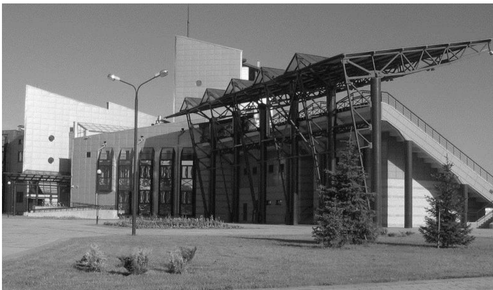
Рисунок 3 – Трибуны Гребного канала в Бресте. Фото 2008 г.

лась созданием веселой, развлекательной скульптуры в городском пейзаже: всем известны Огурец в Шклове, Бобр в Бобруйске, Звездочет в столице области. Минская область лидирует в создании новых производств, в совершенствовании среды проживания, в продвижении инновационных архитектурных форм в сельскую застройку. В Гомеле, еще в период СССР, успешным было признано строительство большепролетного спортивного сооружения из клееных деревянных конструкций. И это могло бы стать темой, выделяющей архитектуру области среди других регионов Беларуси (рис. 3–4).