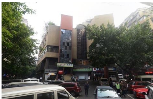
Рисунок 3 – Сельскохозяйственный рынок Сюэтяньвань Даянгоу. 2010 г.

Сельскохозяйственный рынок, расположенный в районе Юйчжун города Чунцин, получил название «Сельскохозяйственный рынок Сюэтяньвань Даянгоу». Это старейший сельскохозяйственный рынок в Чунцине, его строительство восходит к 1940-м (рис. 1). Город Чунцин был второй столицей во время Второй мировой войны, подвергся многочисленным бомбардировкам японскими ВВС, центральная часть города превратилась в руины. Было много бездомных и беженцев, которые строили для проживания дома из подручных материалов, а из уличных киосков формировались рынки для торговли овощами и другими продуктами питания, мелкими товарами и т. д. С ростом количества торговцев в 1950-х вдоль улицы на протяжении 500–600 метров устроили из бамбука киоски, что сформировало открытый рынок с названием «Сельскохозяйственный рынок Даянгоу» (рис. 2). С развитием города он постепенно стал крупнейшим сельскохозяйственным рынком в городе Чунцин. Преобладало обширное открытое пространство, обеспечивая важную общественную функцию, – торговлю. В период плановой экономики этот рынок обеспечивал более половины объема товарного обмена в Чунцине, а в 1980-х был преобразован в рынок свободной торговли. Поскольку он расположен в градостроительно ценном месте города, его официально закрыли 30 июня 2010 г. Но перед этим постепенно в 1997 г. и в 2001 г. для рынка вводили недалеко по улице новые торговые площади. А первоначальное место рынка стало центральным деловым районом.