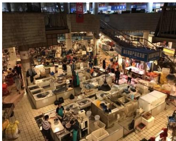
Рисунок 4 – Интерьер сельскохозяйственного рынка Сюэтяньвань Даянгоу. 2010 г.

Поскольку этот рынок был свидетелем и частью городской истории, его возродили на этой же улице Сюэтяньвань, где к этому же 2010 году было построено 5-этажное здание нового сельскохозяйственного рынка в Чунцине (рис. 3–4). Более трети бывших торговцев рынка Даянгоу были размещены здесь, и рынок был переименован в «Сельскохозяйственный рынок Сюэтяньвань Даянгоу». Общая площадь этого 5-этажного рынка около 6600 м 2 : первый этаж – мясо, рыба; второй этаж – зерно, масло, овощи; третий этаж – сухие и соленые продукты; четвертый и пятый этажи – склады. Торговля на рынке основана на оптовых по-