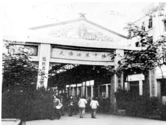
Рисунок 2 – Рынок Даянгоу 1970-х годов

Сельскохозяйственный рынок всегда отражал изменения в привычках питания, образе жизни и материальных потребностях жителей, являлся важной частью истории и культуры любого города. С развитием в настоящее время глобальной интеграции, сельскохозяйственные рынки выражают конкретику географической принадлежности, демонстрируют уникальность города. Поэтому забота об обновлении сельскохозяйственного рынка является неотъемлемой частью развития каждого города, культурного возрождения региона и заслуживает повышенного внимания.