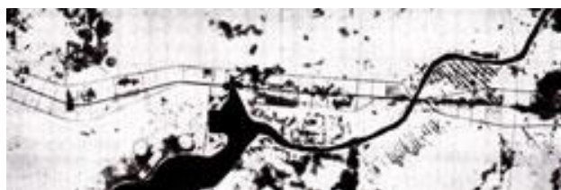
Рисунок 2 – Генеральный план полосы (ленты) расселения

Осью «Зеленого города» являлось автомобильное шоссе. Вдоль него с обеих сторон располагались полосы изолирующих зеленых насаждений. Среди зелени располагалась жилищная застройка. Обязательно было наличие спортивных дорожек и площадок. Внутри города можно было передвигаться с помощью общественного транспорта, который пролегал вдоль шоссе [5] .