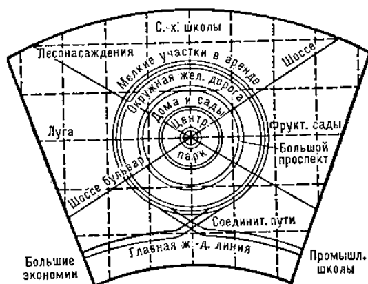
Рисунок 1 – Зонирование «города-сада»

Чтобы повысить удобство при организации городов, можно воспользоваться принципом разделения территории на отдельные участки. Каждый участок будет выполнять свою функцию. Такой принцип организации города был описан Э. Говардом еще в 1898 г. в концепции "города-сада". Структура города – концентрические круги, в центре которых расположен парк с общественными и культурными учреждениями, который опоясывала торговая зона в виде стеклянной галереи, окружённый жилой застройкой. Всё производство вынесено на внешний круг. Под застройку выделялась только шестая часть территории, остальное отводилось под сельскохозяйственные угодья [2].