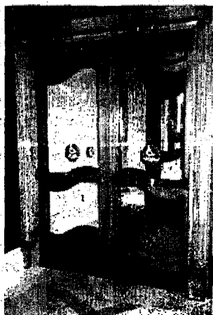
Пиктограмма, обозначающая вход, доступный инвалидам

лей, звуков, запахов. Использование этих языков позволяет решить целый комплекс информационных задач: ориентировать, предупреждать об опасностях и препятствиях, помогать найти путь и запомнить маршрут, стимулировать и облегчать деятельность, снижать зрительное утомление, попеременно воздействуя на различные цветовоспринимающие окончания зрительного анализатора. Каждый язык отличается своим способом кодирования.