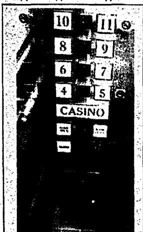
Дублирование шрифтом Брайля и крупным размером кнопок на лифтовой панели

Под универсальностью среды понимается необходимость учета эргономических нормативов и типологических законов формирования среды, оптимальность светового и цветового режимов, техническое совершенство и красота мебели и оборудования, разнообразие тактильных ощущений, мир запахов и звуков. Информационная достаточность выступает как универсальное средство для оптимизации деятельности людей с ограниченными возможностями при помощи предупреждающих и стимулирующих знаков. Язык знаков складывается из цветовых схем, пиктограмм, тактильных раздражите-