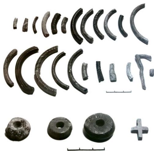
Рис. 3. Стекланные браслеты, шиферные и известковое пряслица, шиферный нагельный крестик из траншеи 1 и шурфа 13.

ТРАНШЕЯ 1 (ок. 20 кв. м.). Траншеей 1 названа зафиксированная на Замковой горе вырытая под канализацию траншея, часть которой (примыкающая к дому 1 по ул. Коммунаров) вырыта вручную.