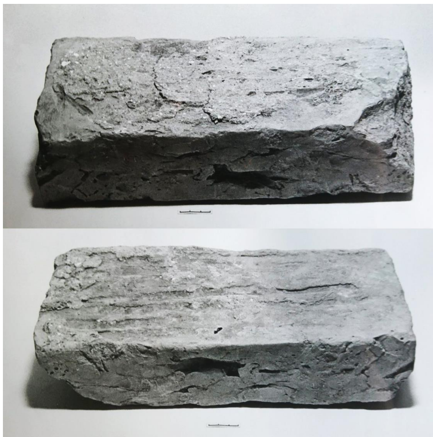
Рис. 2. Целый экземпляр большемерного кирпича XVI в. с двусторонними бороздами, вид с обеих сторон.

Особо следует отметить ранее не известный большемерный кирпич 16 в. с двусторонними бороздами , открытый шурфами 5 и 6 (рис. 2). Размеры кирпичей выявленного сооружения 32,5–36,5x16,5–18,5x8,0–10,0 см.