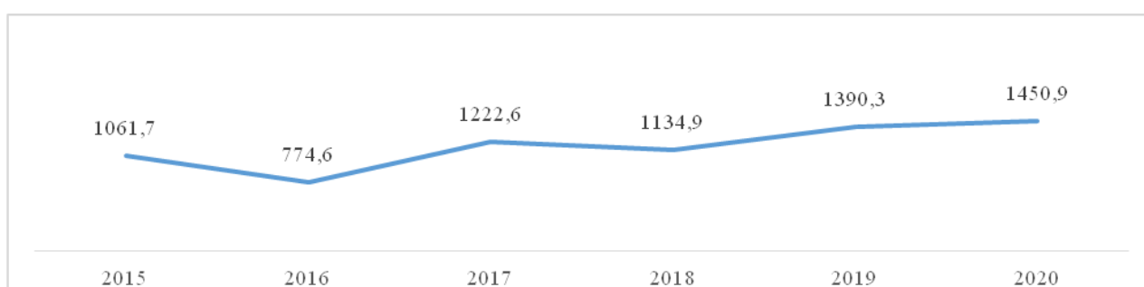
Рисунок 1 – Динамика затрат на технологические инновации, млн р.

Показатели затрат на технические инновации служат показателем роста востребованности перестройки инновационно-активных организаций. Положительная тенденция затрат позволяет предприятиям выпускать более качественную и технически новую продукцию, совершенствуя собственное производство и повышая конкурентоспособность на рынке (рис. 1).