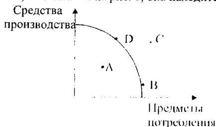
Рис. 1 ЛПВ

2. На рисунке изображена линия производственных возможностей для конкретной экономики. Если она испытывает рецессию, в какой из четырёх точек, показанных на рис. 1, она находится?