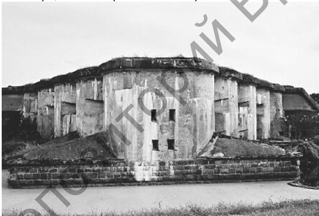
Рисунок 3 – Форт V Брестской крепости

Форт IV. Сохранившаяся казарма используется как складское помещение военной пожарной части. На территории форта жители близлежащих домов ведут рекреационную деятельность и используют в качестве места выгула собак. Областное отделение ОО «Белая русь» выступила с инициативой создания на основе форта мемориального парка, посвящённого событиям Первой Мировой войны. В 2014 году автором был выполнен эскизный проект мемориального парка, в настоящее время ведется поиск средств на его создание.