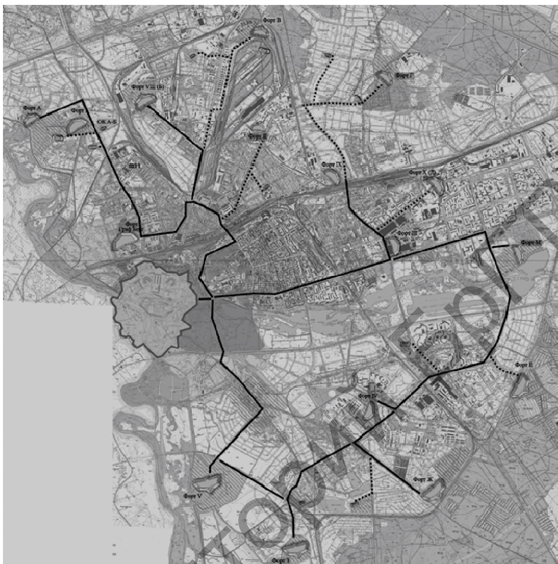
Рисунок 4 – Схема основных и дополнительных туристских маршрутов