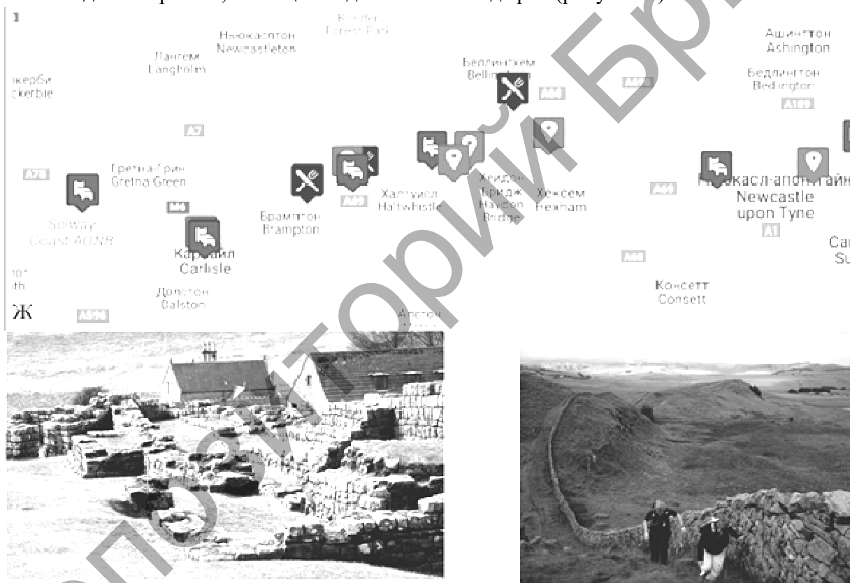
Рисунок 2 – Общая схема объектов посещения и отдельные объекты фортификационного комплекса «Вал Адриана» (Великобритания)

активно посещается туристами. Вдоль стены проложена автомобильная дорога с автостоянками (включая стоянки для туристических автобусов), указателями и информационными стендами. У основных объектов посещения (наиболее интересных и сохранившихся сооружениях) размещаются музеи (в основном небольшие частные музеи и выставочные павильоны), объекты питания и проживания. Создаваемые объекты туристской инфраструктуры и музейные экспозиции размещаются в близлежащих к памятнику зданиях, которые часто имеют историческое значение. Одним из объектов посещения туристского маршрута вдоль Линии Адриана является древнеримский форт Бирдосвальд. Это наиболее сохранившийся участок западной части Линии. В жилом доме XVI в., расположенном среди руин одного из римских фортов, размещается небольшая музейная экспозиция, хостел на 39 мест, небольшое кафе, конференц-зал, магазин сувениров и книжный магазин. Проводятся образовательные программы для школьников и студентов, интерактивные экскурсии, реконструкции исторических событий. На территории форта создана безбарьерная среда: на основных путях передвижения устроены электроподъемники для инвалидов-колясочников, санузел, душевая в хостеле, проходы соответствуют требуемым параметрам; создана информационная среда для инвалидов по зрению, помещение для собак-поводырей (рисунок 2).