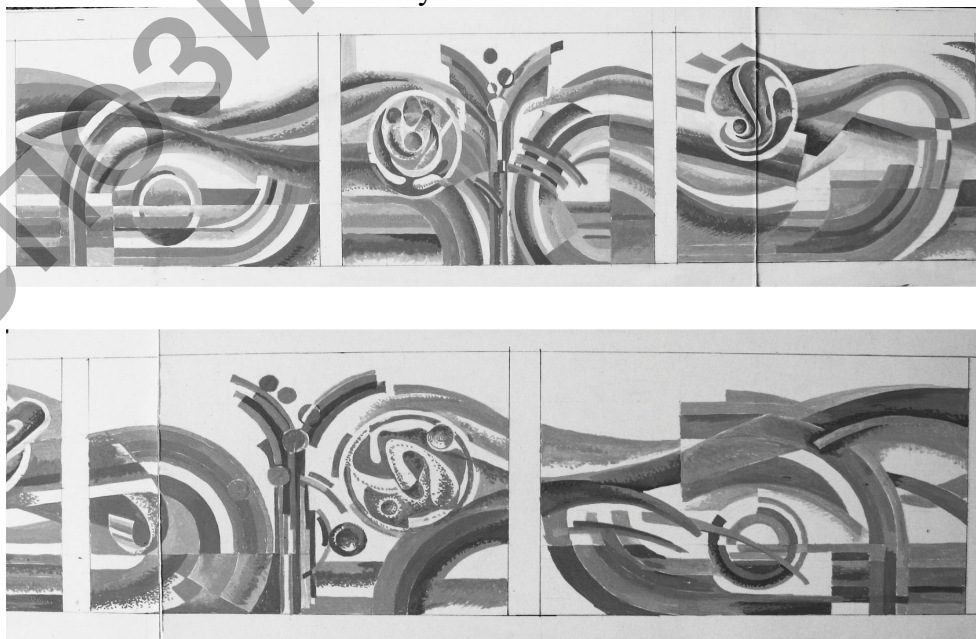
Рисунок 2 – Эскизы