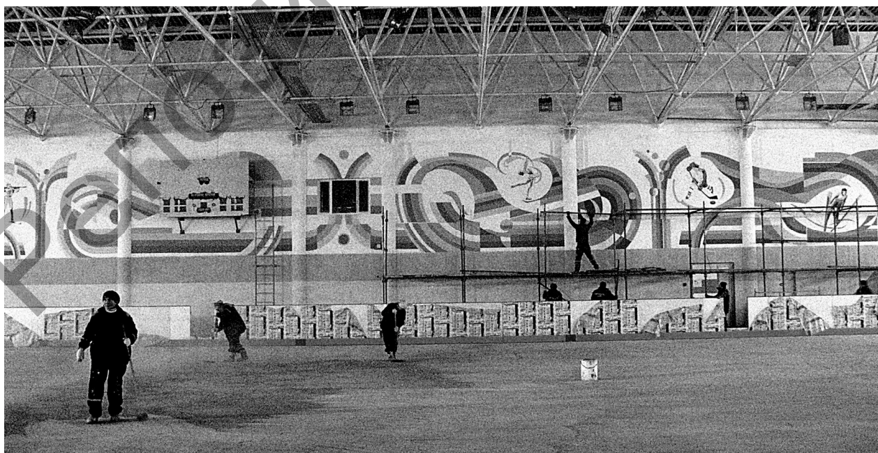
Рисунок 5 – Работа на объекте г. Лунинец