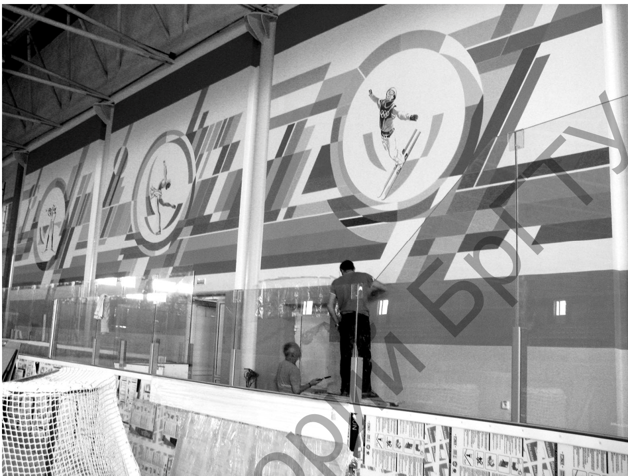
Рисунок 4 – Исполнение на объекте г. Ивацевичи

Площадь суперграфики составляла: 200 м 2 в городе Лунинец и 190 м 2 в городе Ивацевичи (рис. 4, рис.5).