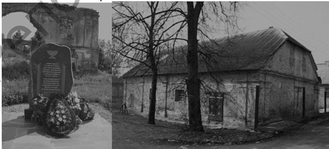
Рисунок 5-6 – Руины синагоги, памятник, синагога-кузня

Сохранились в Высоком синагоги. В начале XVII в. в Высоком была построена первая синагога. Она возведена на левом берегу реки Пульвы. Архитектурные особенности данного архитектурного памятника прослеживаются в строгости форм, высокой четырехскатной крыше. В советское время синагога использовалась как льносклад, а затем как спортзал. В начале 60-х XX столетия было принято решение разобрать здание. В настоящее время от старинной синагоги сохранились только руины. Рядом с ними установлен памятник уничтоженным фашистами евреям, жившим в Высоком. Руины синагоги, памятник, синагога-кузня – на пути из парка Сапегов в центр города Высокого. До настоящего времени сохранилась еще одна синагога, построенная в XVII - XVIII вв. До 1925 г. это был молитвенный дом местной еврейской общины, затем – еврейская школа.