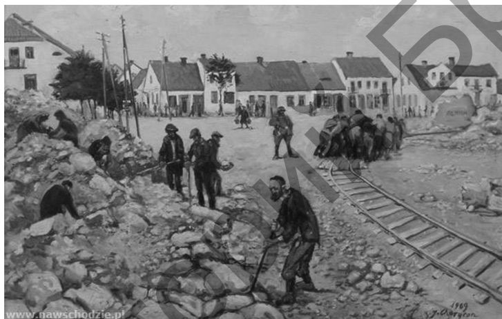
Рисунок 7 – Картина Юзефа Харитона rube.

Свидетель уничтожения Высоковского гетто художник Юзеф Харитон rube в послевоенные годы написал ряд картин об этих событиях. Большая их часть находится в Еврейском историческом институте Польши.