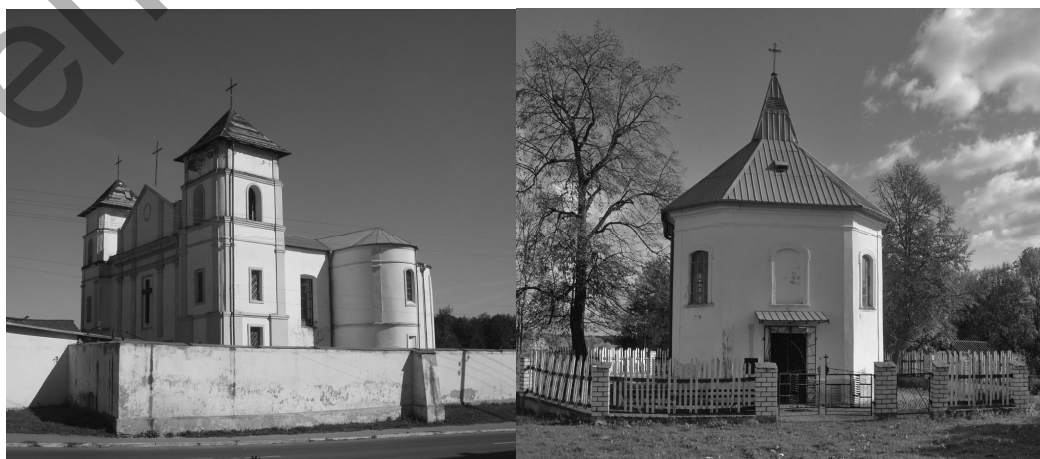
Рисунок 9-10 – Троицкий костел и каплица св. Барбары.