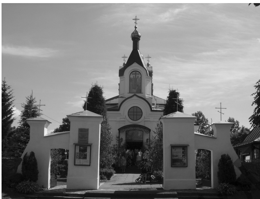
Рисунок 8 – Крестовоздвиженская церковь.