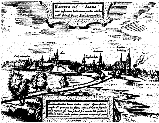
Город-Храм Клецк. Гравюра XVIII в.