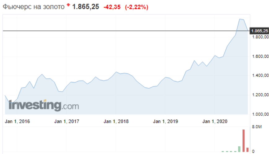
Рисунок 1 – Изменение цены на золото

Единоразовое проведение buy-back не гарантирует наступление кризиса в ближайшее время. Необходимо, чтобы обратный выкуп и выплата дивидендов происходила намного чаще, чем это было ранее. Например, раз в полгода или же ежеквартально. И речь здесь идет не о части прибыли, которая тратится на выплаты дивидендов, как это обычно делают развитые компании, а о всей сумме прибыли, расходуемой на обратный выкуп или дивиденды.