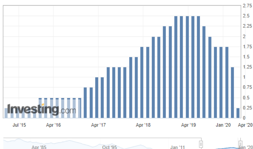
Рисунок 3 – Изменение ставки ФРС США

ный характер (на протяжении 1,5–2 лет для экономик развитых стран). В некоторых случаях наблюдается ставки ниже 0 % (рисунок 3).