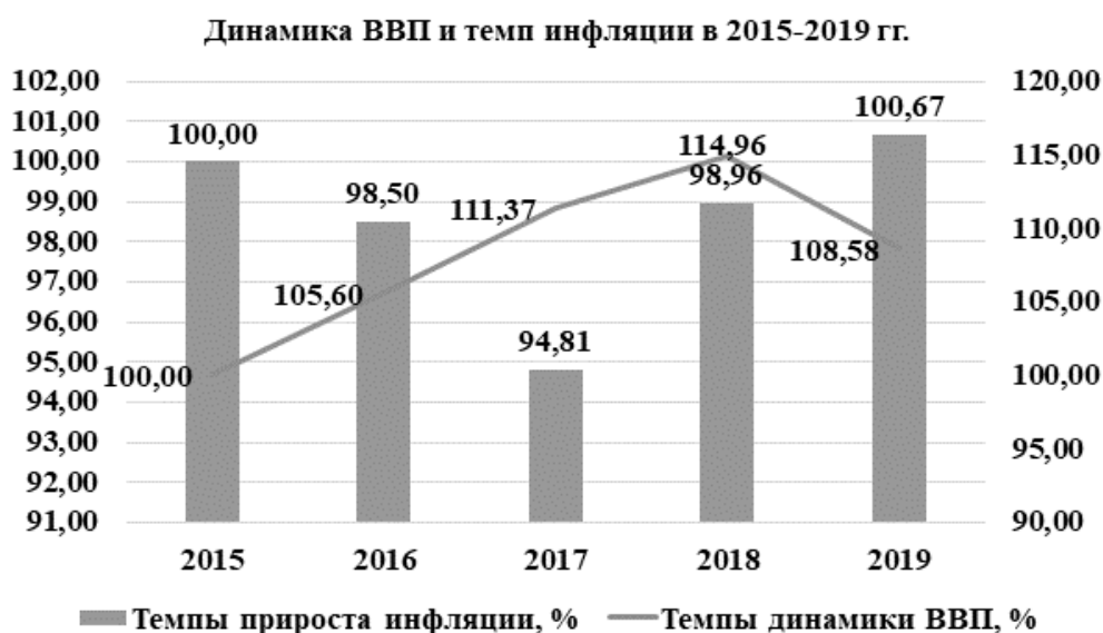
Рисунок 1 – Динамика ВВП и темп инфляции в 2015–2019 гг.