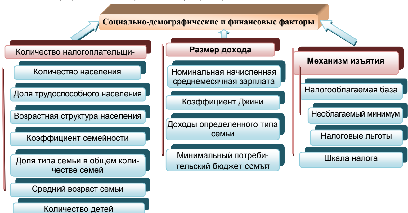
Рисунок 3. Состав факторов для разработки модели ФВН

Для разработки эффективно функционирующего фонда необходимо учесть ряд факторов как социально-демографических, так и финансовых (см. рис. 3):