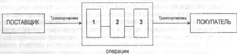
Рис.1 JIT производство

Система «JIT» основана на идее синхронизации процесса доставки товара с потребностью в нем, т. е. на согласовании процессов снабжения, производства и сбыта (Рис.1).