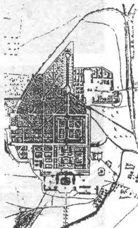
План дворцово-паркового ансамбля.