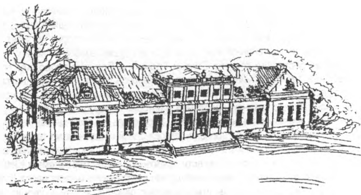
Предполагаемый фасад дворца.