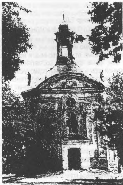
Костел Святой Троицы в 1969 году.