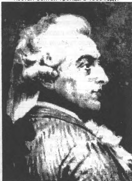
Станислав Август Понятовский.