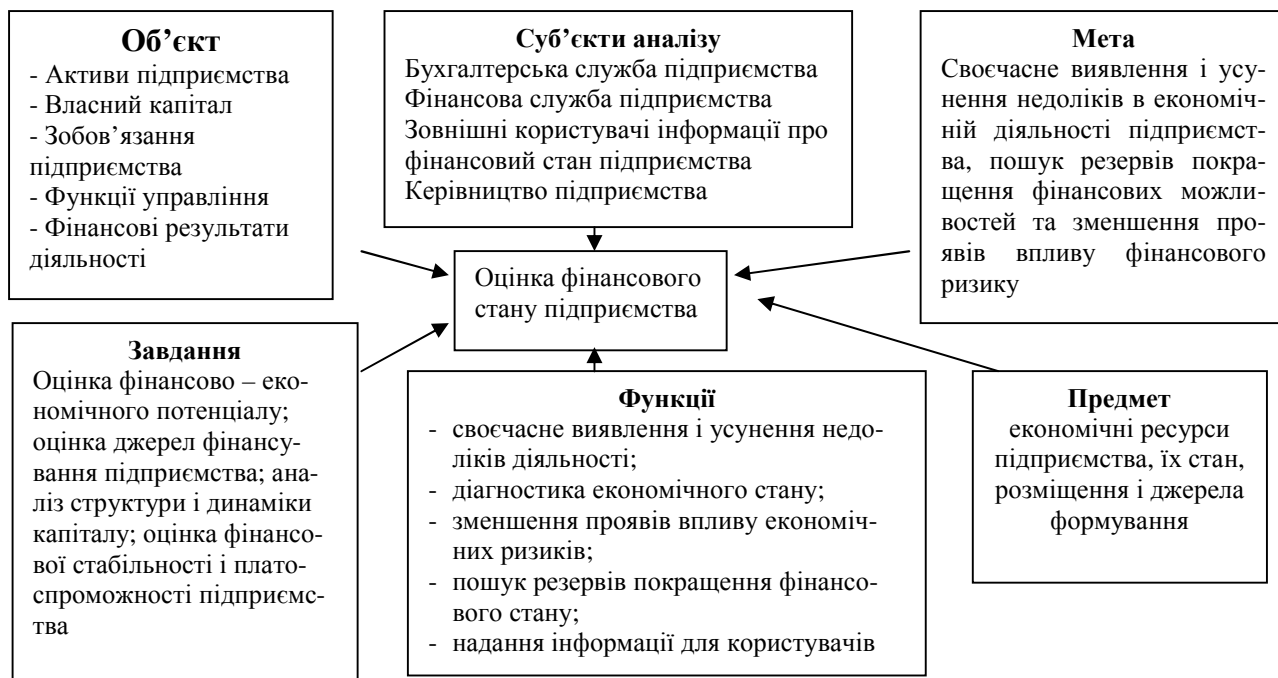
Рис.1. Структурно – логічна схема оцінки фінансового стану підприємства

Для конкретизації існуючих методик оцінки фінансового стану підприємства [5] доцільно виділити структурні елементи його аналізу та оцінки, тобто скласти структурно – логічну схему.