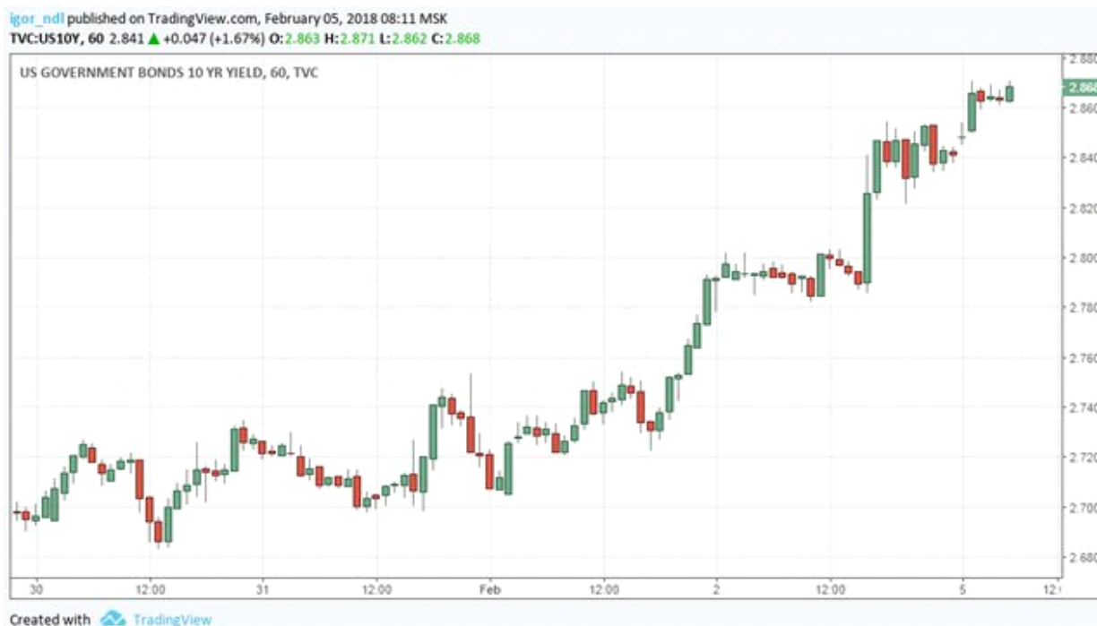
Рис. 1. Доходность десятилетних трежерис США

Важно отметить, что инвесторы почти всегда оказываются не готовы к тому, что именно в данный момент происходит сильное снижение