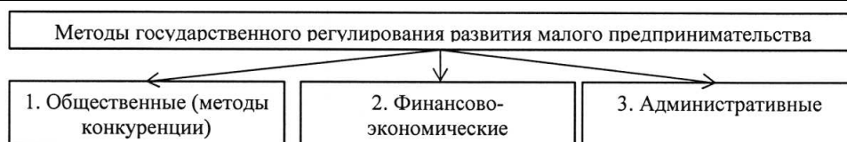
Рисунок 1 – Классификация методов регулирования деятельности малого предпринимательства в Республике Беларусь