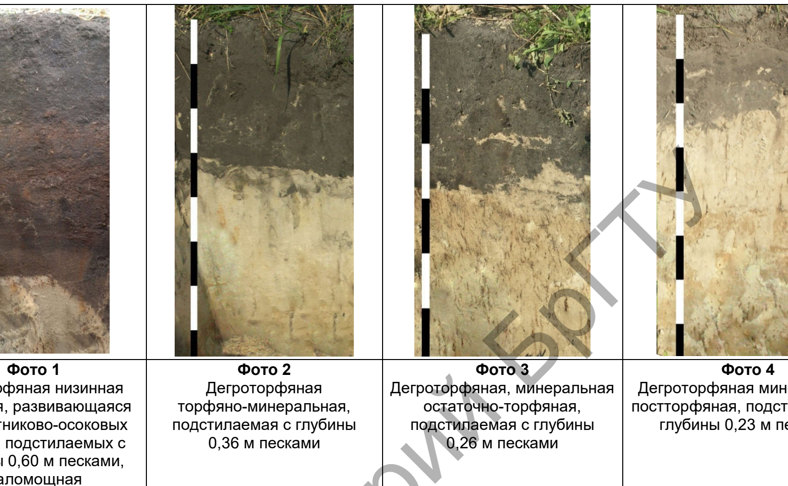
Фото 1-4 – Стадии эволюции осушенных агроторфяных почв на м/о «Копацевичи» в СПК «Новополесье» Солигорского района Минской области