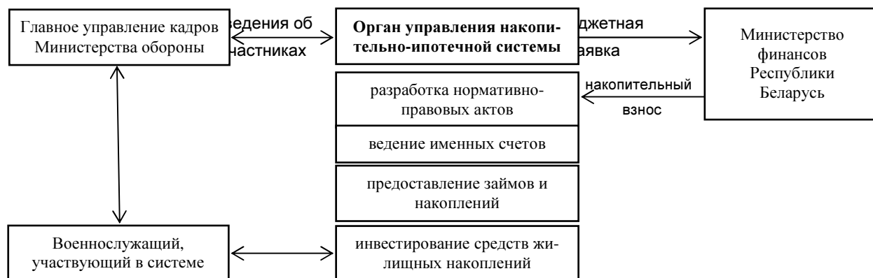
Рисунок 3 – Деятельность органа управления накопительно-ипотечной системы

Для регулирования всей деятельности военной накопительно-ипотечной системы необходимо создание органа управления накопительно-ипотечной системы. Общая схема деятельности данного органа представлена на рис. 3.