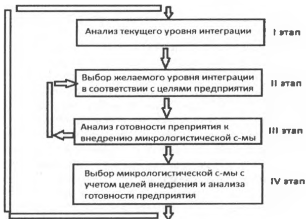
Рисунок 1 – Этапы выбора микрологистической системы

Manufacturing Resource Planning – Планирование Производственных Ресурсов), ERP (Enterprise Resource Planning – Планирование ресурсов предприятия) [2].