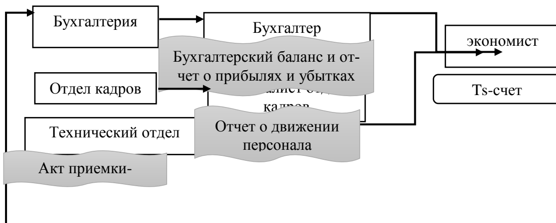
Рисунок 1 – Внедрение системы расчета экономической безопасности предприятия

Методология внедрения алгоритма расчета экономической безопасности субъектов хозяйствования представлена на рисунке 1.